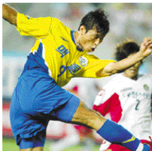
성남일화 천마, '삼성하우젠컵2004' 우승

▶프로축구단 성남일화가 8월 21일 성남종합운동장에서 열린 삼성하우젠컵 최종전에서 대전 시티즌에 극적인 승리를 거두고 우승컵을 안았다.