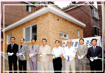
지방자치단체에서는 처음으로 우리시가 추진한 '사랑의 하우스' 만들기 사업이 지난 6월 1일 시자재 8월 17일(대평4동-163호, 대평3

동-1700) 준공식을 가졌다. 이 사업은 시정개발인 '아름다운 환경도시 조성'과 맞닿아는 복지도시' 구현에 걸맞게 정부와 자치단체의 손잡이 미치지 못하는 소외계층의 주거환경 개선을 통하여 훈훈한 사회 분위기를 조성하기 위한 것이다.