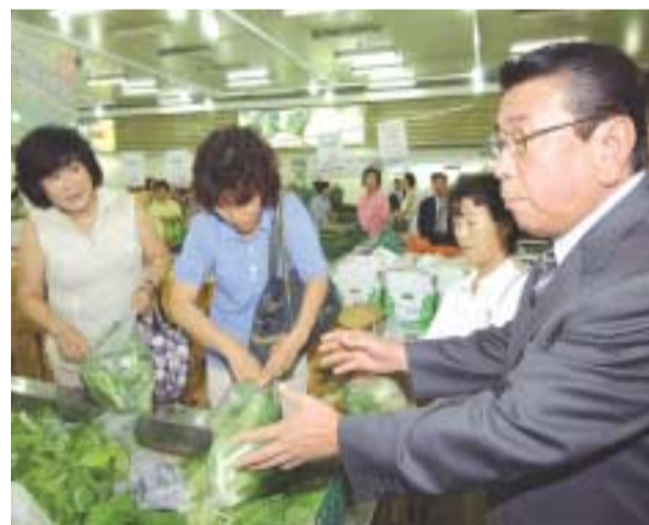
성남농수산물유통센터에서 시민들과 이야기를 나누는 이대엽 시장

창년층 일자리제공 사업을 추진하고 있으며, 시 발주공사의 경우 우리 시민 50% 이상을 고용토록 하는 시책을 펴 지난 2년 동안 189개 사업장에서 13만1천여명을 고용하는 큰 결실을 얻었다.