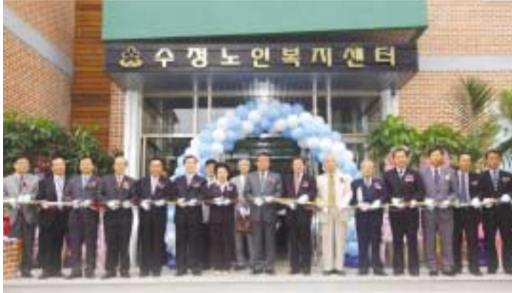
9월 10일...문화취미교실 · 노인전문의원 · 치매노인 주간 보호실 갖춰

시는 최신식노인복지시설로 건립한 수정구 복정동 수정노인복지센터를 지난 9월 10일 개관하였다. 시는 노인을 위한 복지시설 증설이 절실히 요구되는 현실에 맞춰 현대식 노인복지시설을 건립하여 많은 어르신들께 사회참여 기회 확대와 여가 문화 혜택을 드릴 수 있게 되었다고 밝혔다.