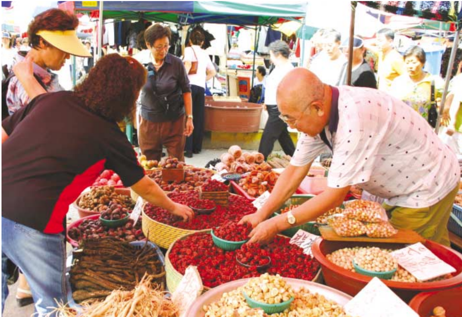
활기를 띠는 추석대목 '모란시장'