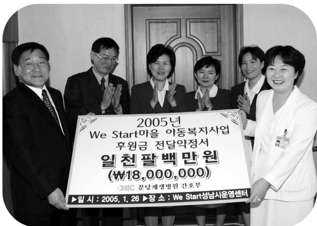
▲ 분당제생병원 간호부 회원들이 양인권 부시장에게 후원금 약정서를 전달하고 있다.

야탑동 We Start마을에 매월 정기적으로 분당 제생병원 간호부 회원들의 성금이 전달된다.