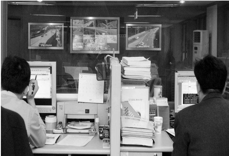
▲ 재난상황실에서 CCTV로 관련 상황을 모니터링 하고 있다.

시가 관내 재난위험 우려지역의 신속대처를 위해 재난감시 CCTV를 설치하는 등 감시 시스템을 구축하고 본격적인 운영에 들어갔다.