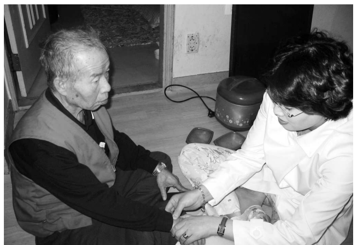
▲ 보건소 관계자가 치매노인의 집을 직접 방문해서 진료하고 있다.

노인인구의 8.3%를 차지하는 치매는 본인뿐만 아니라 가족에게도 정신적, 경제적으로 매우 큰 부담이 되고 있다. 이제 한가족의 문제로만 방치할 수 없어 시는 치매환자관리를 전문기관에 위탁, 보다 내실있는 프로그램을 운영할 계획이다.