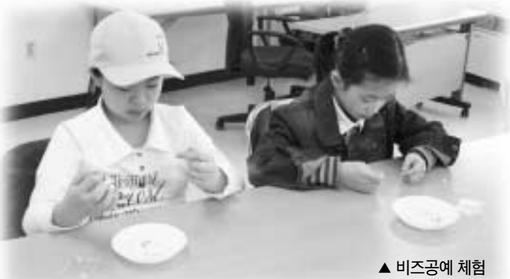
▲ 비즈공예 체험

농익는 가을, 성남의 청소년들을 위한 축제 등 프로그램이 다채롭게 펼쳐진다.