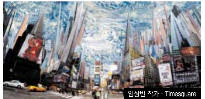
임상빈 작가 · Timesquare