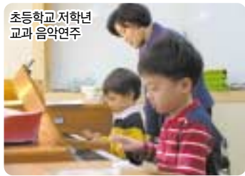
초등학교 저학년 교과 음악연주