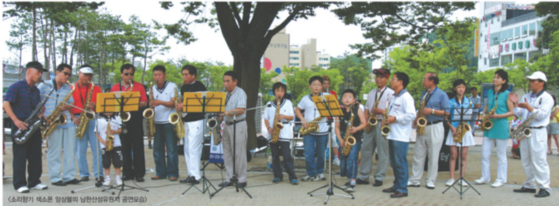
(소리향기 색소폰 앙상블의 남한산성유원지 공연모습)

6~10월 야외 미니콘서트·영화상영·길거리 토요무대 등 풍성 = 이제 공연장과 영화관을 찾아가지 않고도 공원이나 길거리에서 쉽게 문화공연을 접할 수 있게 됐다. 성남시는 6월부터 10월까지 상대적으로 문화혜택이 적은 수정구·중원구를 중심으로 시민이 즐겨찾는 공원 등에서 저녁시간대에 '시민을 찾아가는 예술행사'를 연다. 시립예술단과 관내 민간예술단체가 참여하는 야외 미니콘서트, 야외 영화상영, 길거리 토요무대 등이 선보인다.