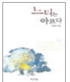
저 자 : 이용포 출 판 사 : 푸른책들 출판년도 : 2006년