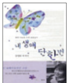
저 자 : 장영희 출 판 사 : 샘터 출판년도 : 2000년