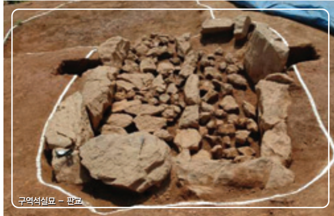
구역석실묘 - 판교

이쯤 되면 도대체 신라사람들의 정신세계까지 의심스러워지기도 한다. 하지만 이런 무덤쓰기는 신라사람들이 처음 사용한 것은 아니