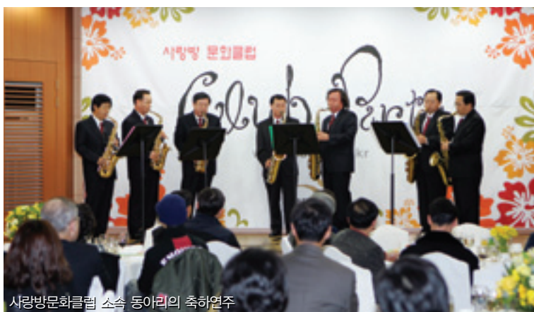
사랑방문화클럽 소속 동아리의 축하연주