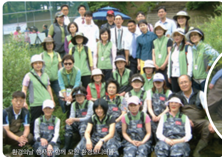
환경의날 행사후 함께 모인 환경모니터들

하는 효과를 얻었어요. 자연환경은 꼭 필요한 것이고 개선방법 역시 시민이 주가 되어야 가장 바람직합니다. 모니터 활동은 지역사회에 기여하고 동참하는 기회가 되므로 자긍심을 갖고 적극적으로 참여할 것"을 부탁한다. 시민모니터활동은 환경개선대책 등 정책반영에 필요한 실태와 문제점을 폭넓게 의견 수렴하여 Feed-back 기능을 강화할 수 있는 활동인 것이다. 자연은 막연히 동경만 할 것이 아니라 적극적인 참여로 함께해야