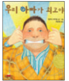
저 자 : 앤서니 브라운 출 판 사 : 킨더랜드 출판년도 : 2007년