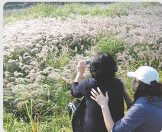
분당구 구미동 서울시니어스분당타워 앞 탄천변. 숲에서 카메라에 가을을 담고 있는 친구의 뒤에서 카메라 속 가을을 엿보고 있다.