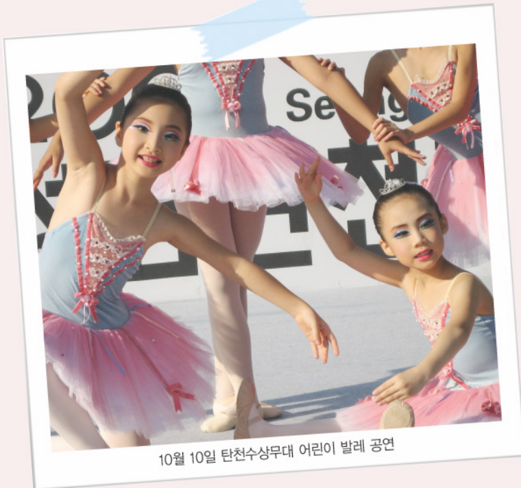
10월 10일 탄천수상무대 어린이 발레 공연