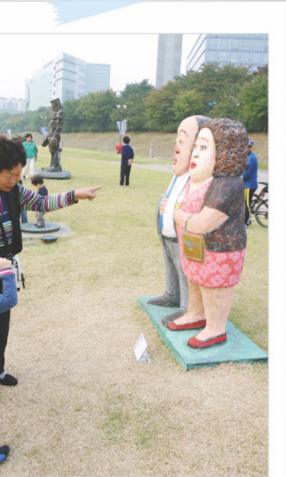
10월 4~13일 탄천변 야외조각전

특히 8일 개막식 때만 5만여 명이 참여한 2008 성남탄천페스티벌(8~12일)은 좀처럼 보기 힘든 국내외 유명 공연과 성남시립예술단의 위력을 보이며 체험프로그램 등을 곁들여 시민들은 물론 주변 지역의 많은 관람객을 끌어들이는 기염을 토했다. 아직도 문화 열기가 느껴지는 성남시민축제 현장 이모저모를 엿어본다.