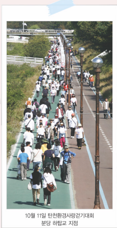
10월 11일 탄천환경사랑걷기대회 분당 하탑교 지점