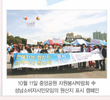
10월 11일 중앙공원 자원봉사박람회 중 성남소비자시민모임의 원산지 표시 캠페인