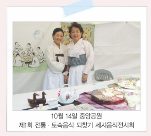
10월 14일 중앙공원 제1회 전통·토속음식 되찾기 세시음식전시회