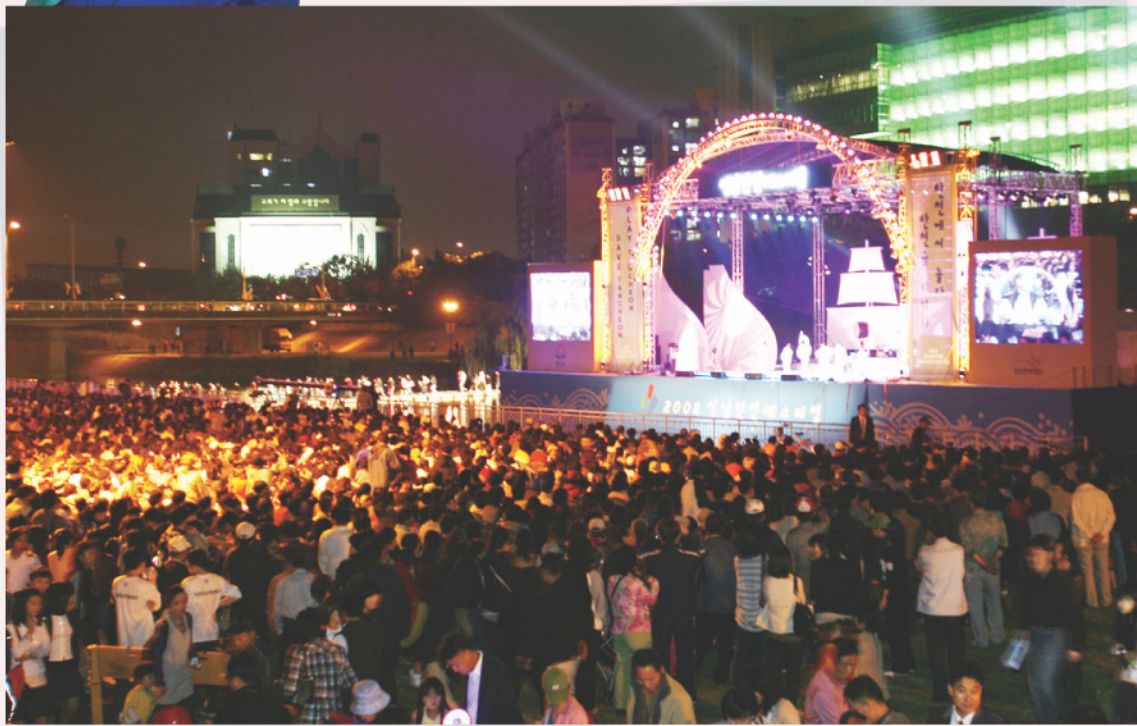
10월 8일 탄천 페스티벌 개막식. 5만 여명의 관중이 모여 성황을 이뤘다.