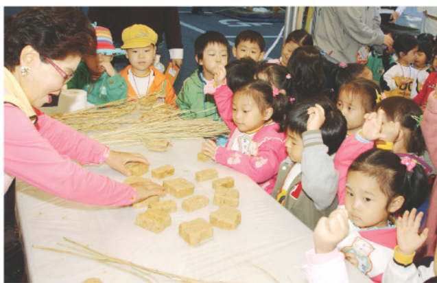
지난해 인기를 끌었던 꼬마메주 만들기 행사

이번 행사에서는 그동안 농업기술센터 가정원에 교육생 및 생활개선회원들의 교육 결과물을 토대로 한 가정원에 작품전시회(분재·야생화 등 300여 점)와 생활기술 작품전시회(천연염색·규방공예), 우리음식 연구회를 주축으로 한 전통 떡·음청류 전시회, 우리 농산물과 수입농산물 비교 전시회 등 볼거리 마당을 펼친다.