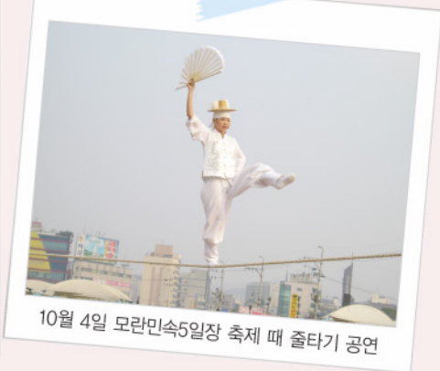
10월 4일 모란민속5일장 축제 때 줄타기 공연