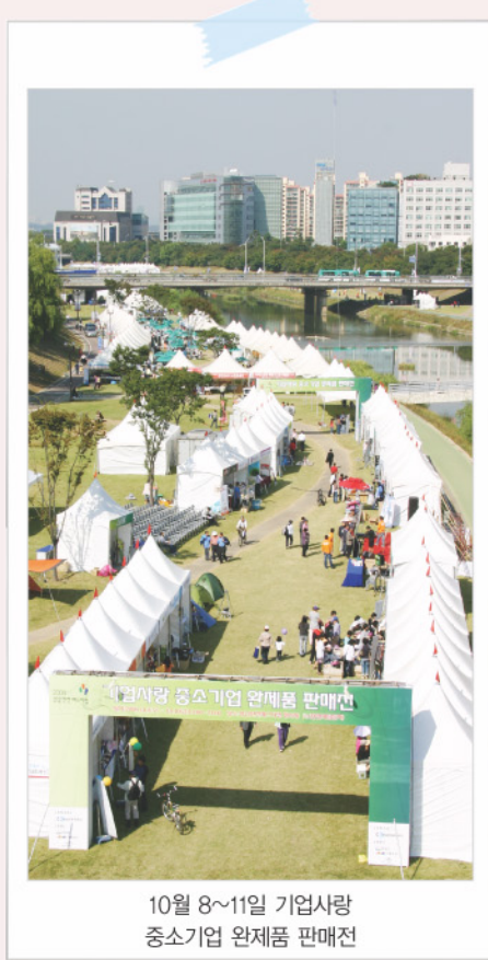
10월 8~11일 기업사랑 중소기업 완제품 판매전