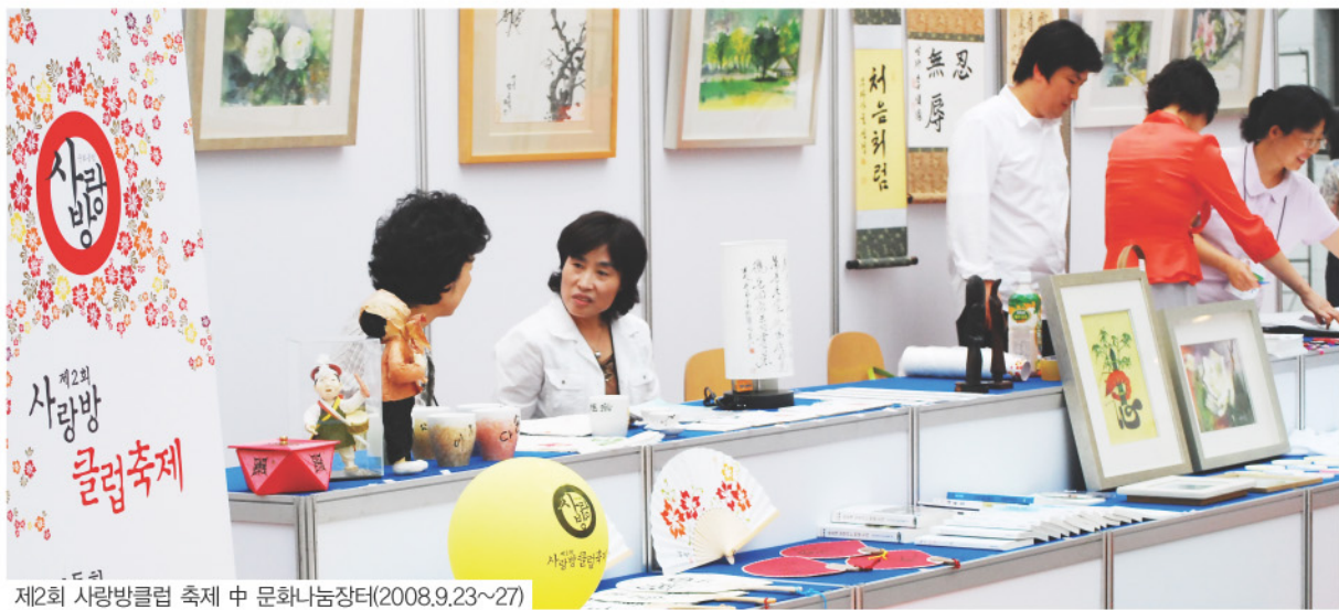
제2회 사랑방클럽 축제 중 문화나눔장터(2008.9.23~27)

사랑방문화클럽 축제 중 '임종 전 소원 들어주기 화려한 외출' 행사가 있었다. 마지막 생을 정리해야 하는 시점을 앞두고 사람들은 나이와 성별에 따라 각기 다른 소원들을 내놓았다. "멋진 문화공연을 보고 싶다." "맛있는 뷔페 식사를 하고 싶다." 그들의 소원대로 행사에 참여한 많은 사람들은 멋진 공연도 보고 맛있는 식사도 할 수 있었다. 많은 돈이 들었겠지? 돈은 어디에서 나왔을까? 우리의 예상을 깨고 현금은 한푼도 들지 않았다.