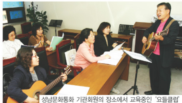
성남문화통화 기관회원의 장소에서 교육중인 '요들클럽'

제공하고 유지하기, 더 나아가 사용하지 않는 물건 나누기, 아기 돌보거나 애완동물 산책시키기 등 다양하다.