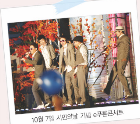
10월 7일 시민의날 기념 e푸른콘서트