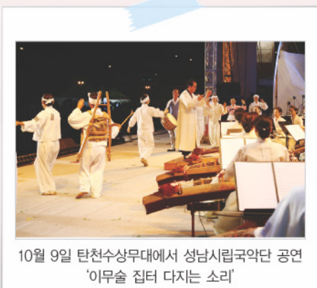
10월 9일 탄천수상무대에서 성남시립국악단 공연 '이무술 집터 다지는 소리'