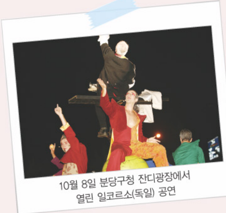
10월 8일 분당구청 잔디광장에서 열린 일코르소(독일) 공연