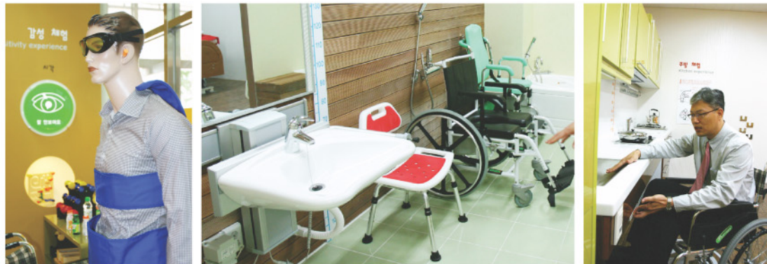
체험내용을 직접 설명해주는 원병희 사무국장. 왼쪽부터 노인의 몸으로 만들어 진행되는 감성체험, 욕실체험, 주방체험 현장

※ 자원봉사자 모집 = 생애 · 체험전시관 안내 및 상담, 프로그램 운영을 보조할 자원봉사자를 모집한다. 대상은 30~65세이며 봉사기간은 10월 13일~12월 31일(10:00~17:00)이다. 문의754-8434