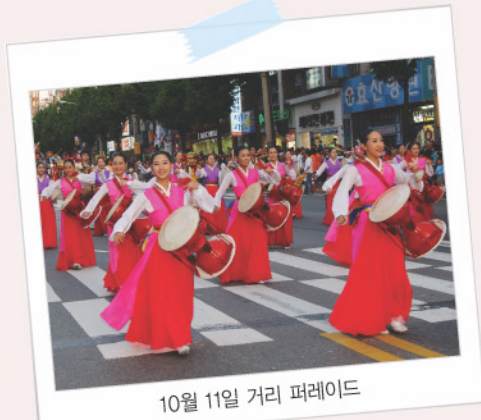
10월 11일 거리 퍼레이드