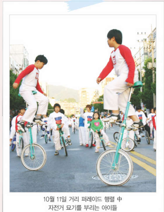
10월 11일 거리 퍼레이드 행렬 중 자전거 묘기를 부리는 아이들