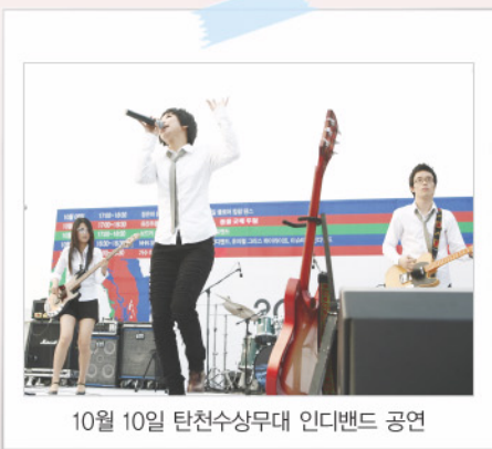
10월 10일 탄천수상무대 인디밴드 공연