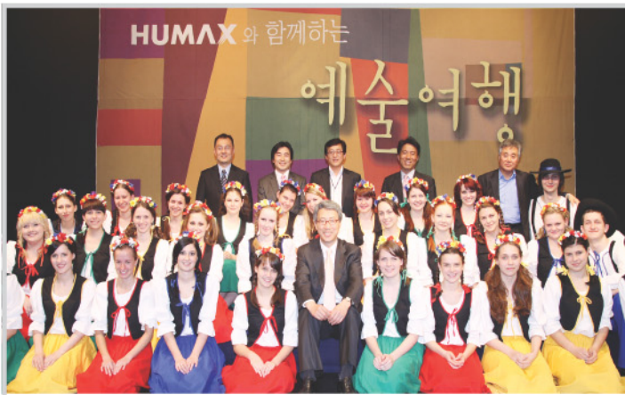
지난 5월 개관 1주년을 맞아 특별공연한 60년 전통의 유럽 정상 합창단 '체코 프라하 소년소녀 합창단'과 함께

- 다음 호는 해방 이후 현대시기의 성남 - 도움말=성남시 학예연구사 진영옥 729-3013 박인경 기자 ikpark9420@hanmail.net