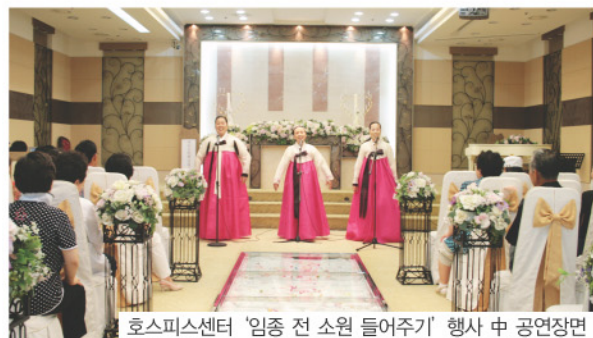
호스피스센터 '임종 전 소원 들어주기' 행사 중 공연장면

성남문화통화 참여 방법은 공간 빌려주고 빌리기, 피아노나 컴퓨터 가르치기와 배우기, 공연·전시·봉사 등을