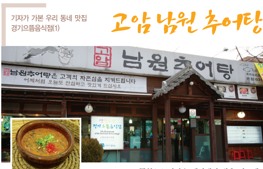
기자가 가본 우리 동네 맛집 경기 으뜸음식점(1)