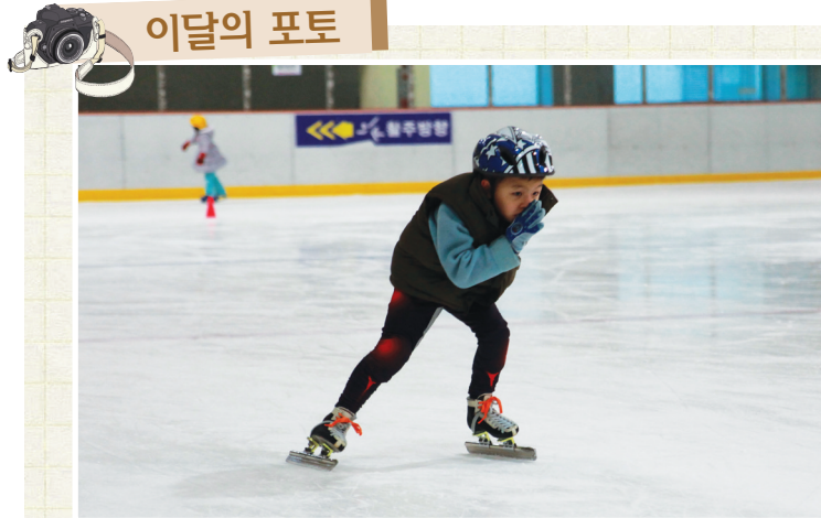
겨울의 천국, 단천종합운동장내 실내 빙상장에서 귀여운 꼬마아이가 얼음을 지치고 있다. 이종욱 | 중원구 하대원동