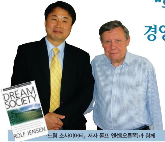
“드림 소사이어티” 저자 롤프 엔센(오른쪽)과 함께

“위대한 소설가가 이야기를 상상해내듯이 경영의 미래 역시 상상하는 것이다.”