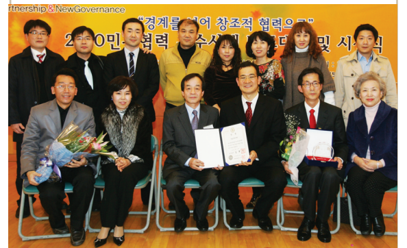
사랑방문화클럽 운영위원들과 직원들 |

성남문화재단의 대표적인 문화정책사업 〈사랑방문화클럽〉은 지난 12월 2일 민관협력포럼이 주최하고 행정안전부, 중앙일보, 전국경제인연합회, 거버넌스21클럽, 전국지속가능발전협의회가 후원한 '2010 민관협력 우수사례 공모대회'에서 시민 주체의 생활문화공동체 활성화에 대한 기여로 대상인 국무총리상의 영예를 안았다.