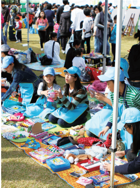
(사진) 어린이가 주인인 경제벼룩시장

5월 28일(토) 오후 2시 분당구청 앞 잔디광장서 www.snmf.or.kr 성남산업진흥재단 740-1451