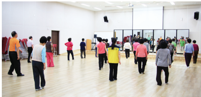
다양한 양질의 프로그램 제공