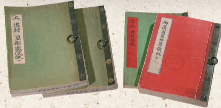
▲ 조선왕조의 의궤

제2실은 왕실문화 중 <의례와 행사>, <출생과 교육>, <여성의 일상> 1882 ( 19),