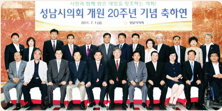
시민과 함께 밝은 내일을 창조하는 의회! 성남시의회 개원 20주년 기념 축하연 2011. 7. 1(금) 성남시의회