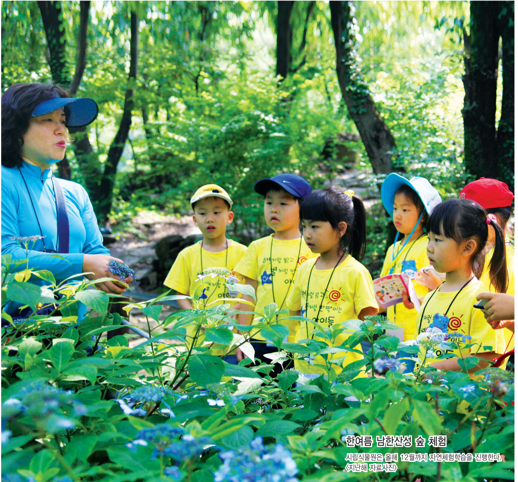
한여름 남한산성 숲 체험

발행처 성남시 | 편집처 홍보담당관실 | 주소 우)462-700 성남시 중원구 성남대로 997 | 전화 1577-3100 콜센터 · 031-729-2114 대표 | http://snvision.cans21.net