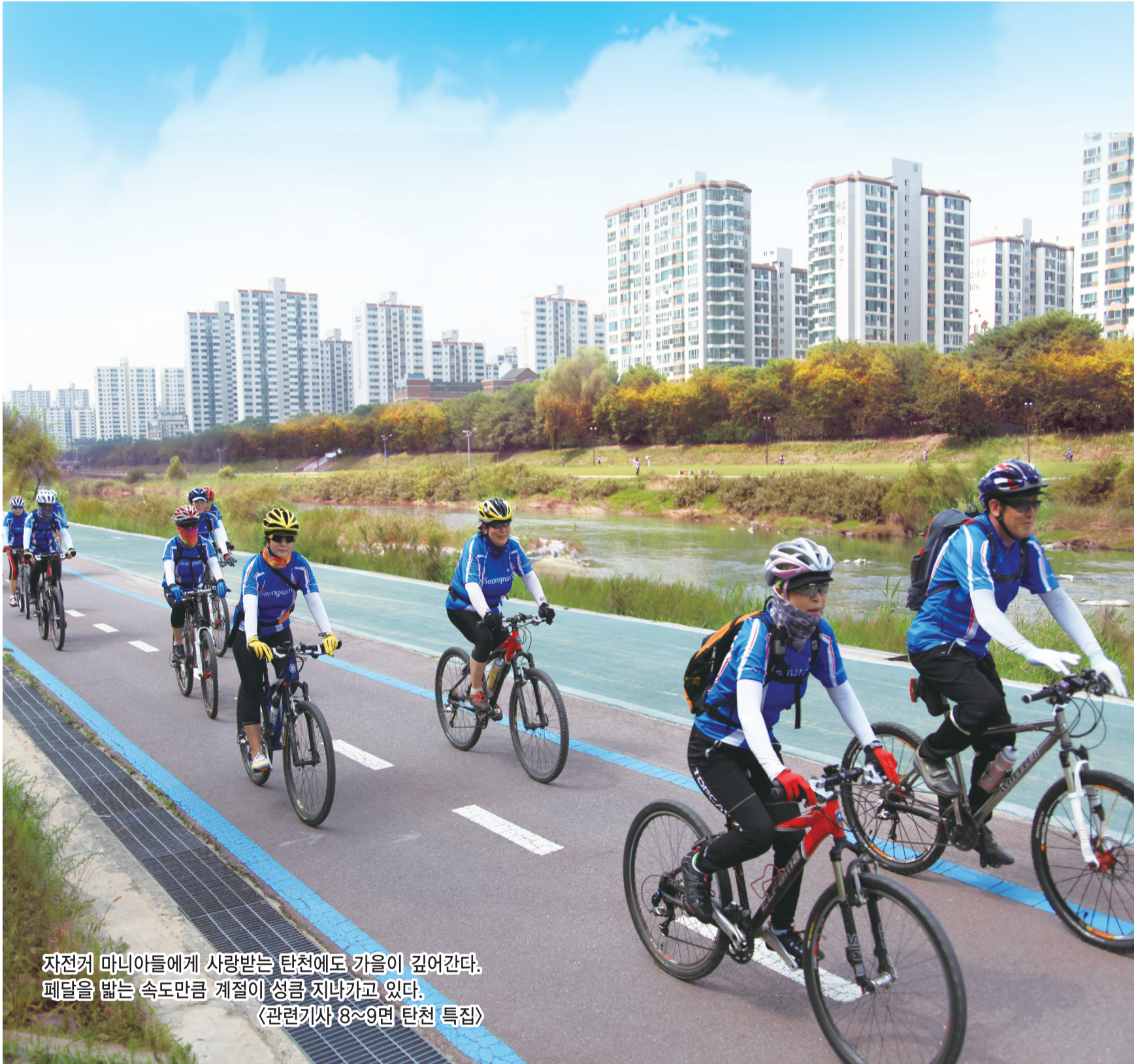
자전거 마니아들에게 사랑받는 탄천에도 가을이 깊어간다. 페달을 밟는 속도만큼 계절이 성큼 지나가고 있다. 〈관련기사 8~9면 탄천 특집〉

발행처 성남시 | 편집처 홍보담당관실 | 주소 우)462-700 성남시 중원구 성남대로 997 | 전화 1577-3100 콜센터 · 031-729-2114 대표 | http://snvision.cans21.net