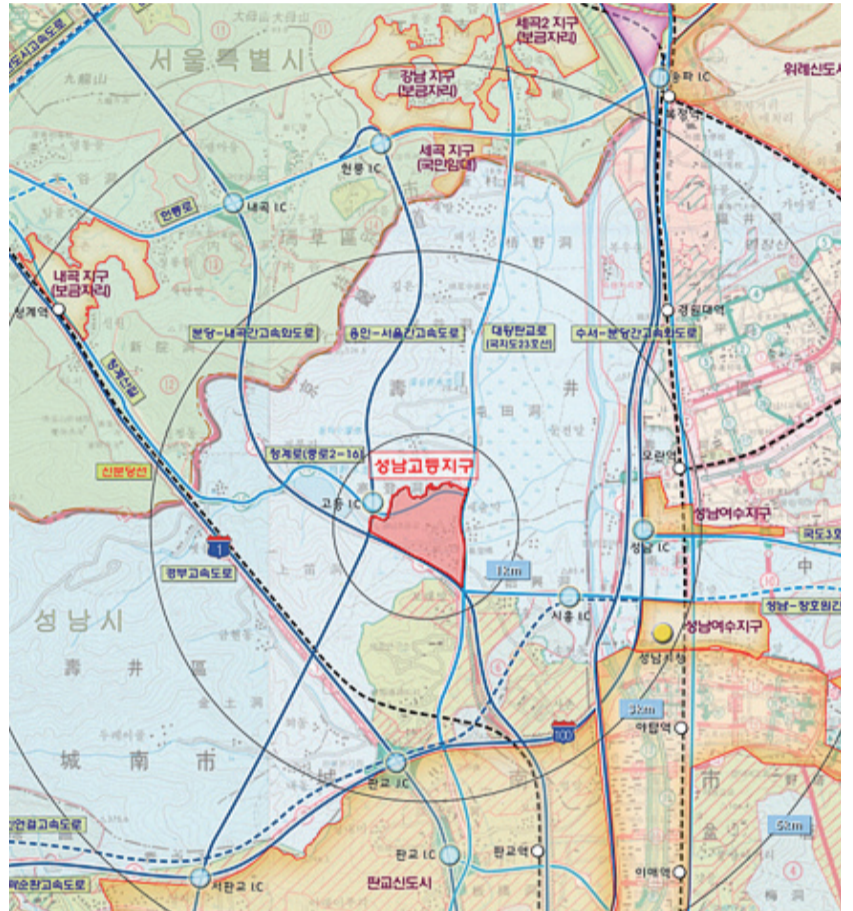
국토해양부 공공택지기획과 02-2110-8328, 성남시 택지개발과 729-4502

3 가 3,960가 56 9 m 2 10 10 가 3,960가 3,006가 가 (60m 2 , 60~85m 2 ) 1,304가 , 10 761가 , 941가 2 161가 60 m 2 ( )' 가 가가 ~ , 23 ( ) , 가 8