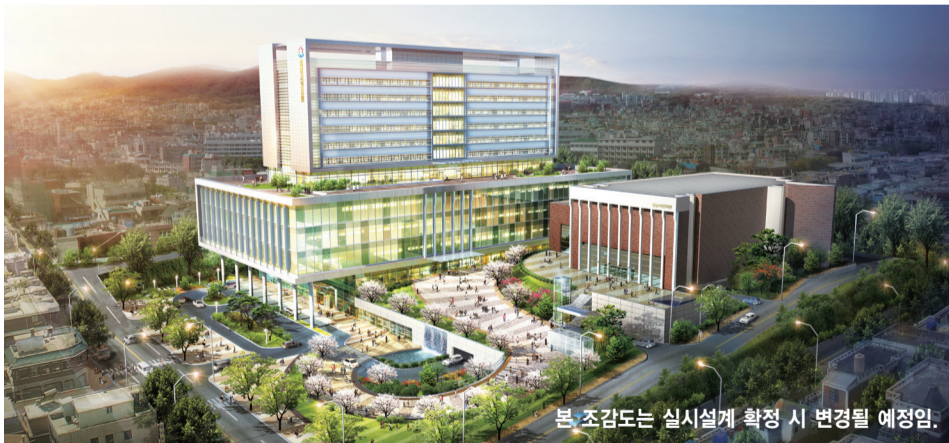
본 조감도는 실시설계 확정 시 변경될 예정입니다.