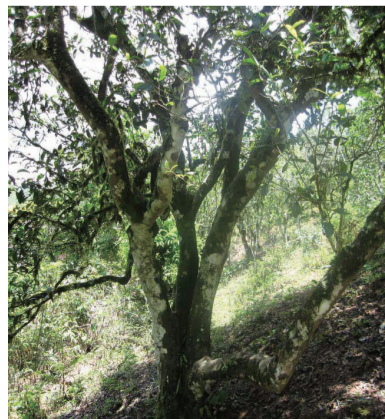
수령 8백년이 넘었다는 운남 이무정산 의방산 정상에 있는 차나무. 이처럼 차는 시간의 즐거움이다.

몇 년 전 선운사에 갔다가 작은 동백을 한그루 샀습니다. 보이차 찌꺼기를 거름으로 주어서인지, 북방 한계선이 북상한 때문인지, 동백이 잘 자랐