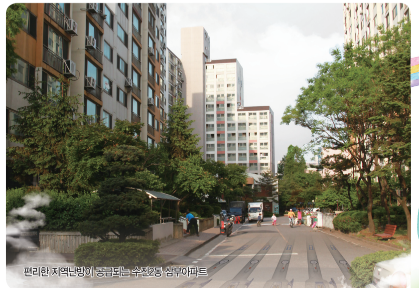
편리한 지역난방이 공급되는 수정2동 삼부아파트