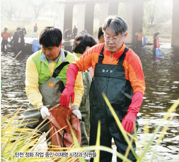
탄천 정화 작업 중인 이재명 시장과 직원들