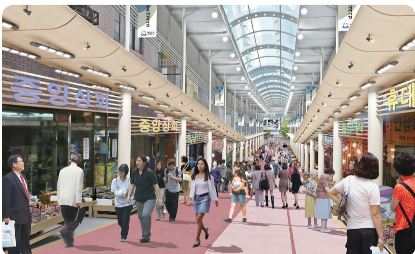
상권이 활성화된 후 태평동 전통시장 저자거리(수정북로 조감도)