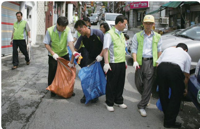
골목을 깨끗하게. 주민불편사항인 쓰레기를 신속 수거중

지난 2010년 7월 1일 민선5기 시정부가 출범하면서 가장 중심에 둔 것은 시민과의 소통이다. 시민들 삶의 현장, 그곳에 시정 운영의 답이 있다고 생각하고 이재명 성남시장과 구청장, 동장 등 간부공무원은 이른 새벽부터 밤늦도록 탄천, 전통시장, 재개발사업현장, 복지시설 등 민생현장을 구석구석 찾아 시민의 애로사항과 건의사항을 경청해왔다. 작은 의견 하나라도 시민의 생각이라면 긍정적으로 검토하고 시책에 반영할 게 없는지 고민하며 시민과의 간격을 좁혀왔다. 시민이 주인인, 진정한 시민주권시대를 여는 발로 뛰는 현장행정의 걸음걸음을 살펴본다.