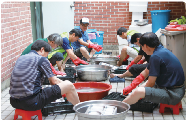
성남시 공무원, 노인전문요양원에서 배식 후 설거지 봉사