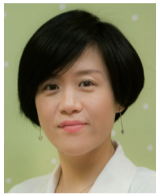
유희정 성남시 소아청소년 정신건강센터장 분당서울대병원 신경정신과 교수