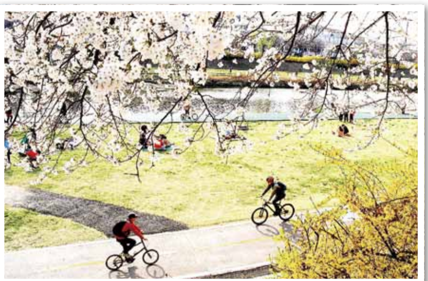
탄천에 봄! 봄! 박상근 분당구 이매동

매년 5월이면 어린이날을 기념해 학교 운동장에서 열심히 뛰고 달리는 봄 운동회가 가장 기다려진다. 이날만큼은 엄마 아빠 앞에서 최선을 다해 경기하는 아이들 모습이 대견하다. 사진은 지난해 성남초등학교 봄 운동회다.