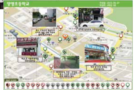
양명초등학교 4학년 1반 아이들이 만든 아동 안전지도(2013년 9월)

등갯길, 집 밖을 나서는 아이들은 많은 위험에 노출된다. 위험하지만 등하교 시간이 조금 단축되는 길을 선택해 등교하는 아이들은 자신이 얼마나 많은 위험에 노출돼 있는지 모른다.