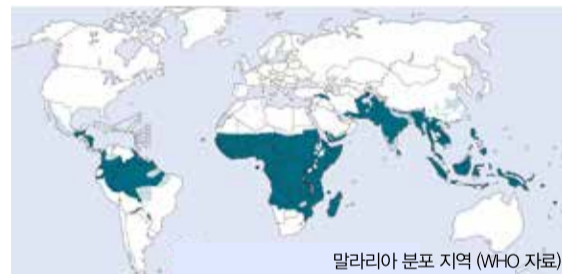
말라리아 분포 지역 (WHO 자료)

경기동부근로자건강센터 031-739-9301, www.gdwhc.or.kr