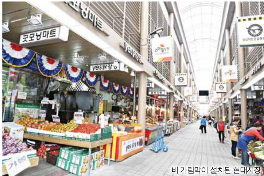
비 가림막이 설치된 현대시장