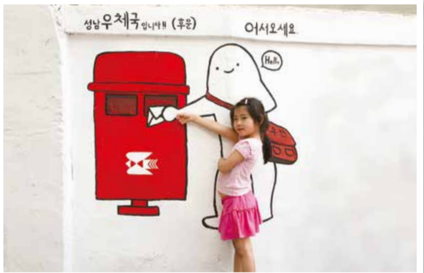
그리운 사람에게 편지를 쓰세요 박서현 중원구 성남동

우리나라 고유종으로 멸종위기종 2급인 금개구리. 성남시 자연환경모니터가 지난 6월 탄천습지생태원 모니터링 중 발견한 금개구리다. 금개구리는 물 밖으로 나오는 일이 거의 없고 물이 더러워지면 살기 어렵다. 금개구리의 특징인 등 양쪽의 금색 줄이 올챙이 몸에도 선명하다.