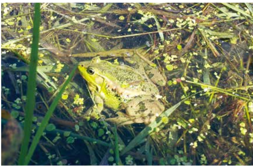
금개구리 강미옥 분당구 이매동

우리나라 고유종으로 멸종위기종 2급인 금개구리. 성남시 자연환경모니터가 지난 6월 탄천습지생태원 모니터링 중 발견한 금개구리다. 금개구리는 물 밖으로 나오는 일이 거의 없고 물이 더러워지면 살기 어렵다. 금개구리의 특징인 등 양쪽의 금색 줄이 올챙이 몸에도 선명하다.