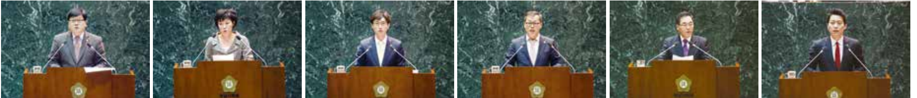
▲ 노환인 의원