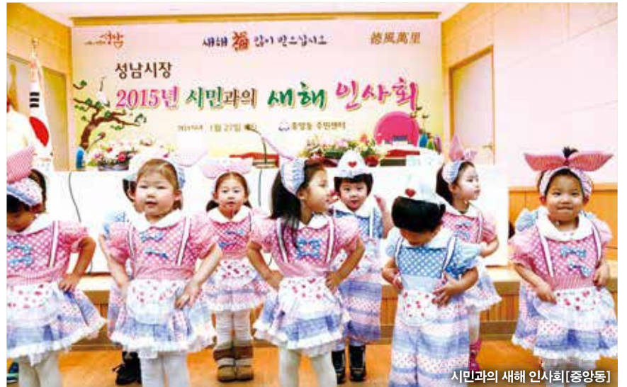
시민과의 새해 인사회[중앙동]

어르신에서부터 어린이, 청소년, 주부, 기관단체 등 남녀노소를 불문하고 매회마다 자리는 꼭 채워졌고, 시종 일관 웃음소리가 장내를 떠나지 않을 만큼 화기애애한 분위기에서 질문하기 위해 앞서거나 뒤서거나 손을 들었다. 특히 이번 인사회에서는 초등학생과 청소년이 대다수 참석해 공공성 강화 정책 중 하나인 ‘성남형 교육’에 대해 질문하는 등 지방자치를 직접 체험하는 학생들의 모습이 눈길을 끌었다.