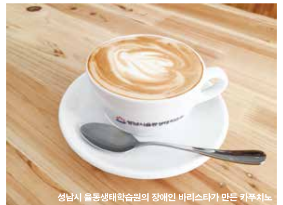
성남시 울동생태학습원의 장애인 바리스타가 만든 카푸치노