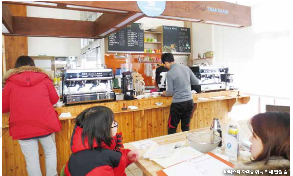
바리스타 자격증 취득 위해 연습 중

고로 제3자의 신체나 재물에 대한 손해를 입혔을 때 법률상 배상책임이다. 법률상 손해 배상금, 손해경감·방어·권리보전 비용을 배상해 준다. 보장금액은 대인, 대물 사고에 최고 1억 원이다. 배상책임보험 가입 기간은 금년 12월 18일까지다.