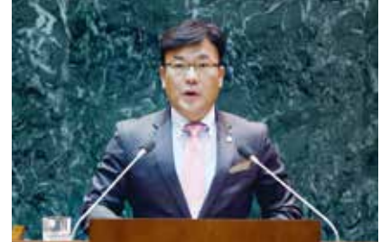
▲ 새정치민주연합 대표 최만식 의원