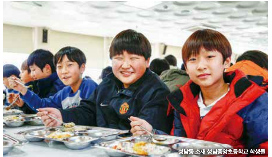
성남동 소재 성남중앙초등학교 학생들

이를 위해 올해 3월부터 49억 원의 예산으로 초·중학교가 성남시 학교급식지원센터를 통해 친환경 우수농산물을 구매할 경우 일반 농산물 구매비와의 차액 전액을 보전해 준다. 친환경 우수농산물 공급액의 33%를, 김치 등 가공식품은 30%를, 친환경 쌀은 정부미 가격으로 각각 학교에