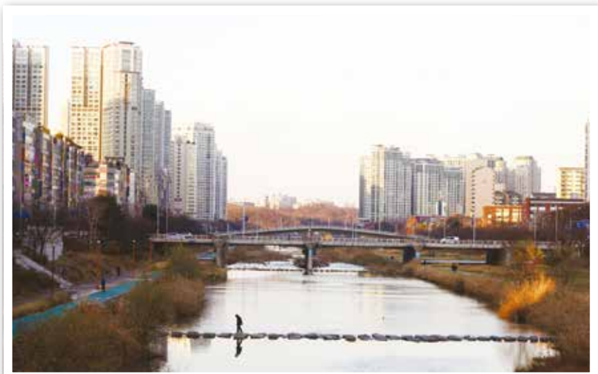
봄이 오는 그곳으로