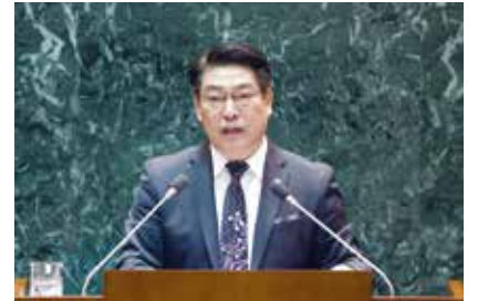
▼ 새누리당 대표 이상호 의원