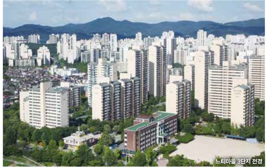
느티마을 3단지 전경

에 대한 평가를 실시해 수직증축 가능여부를 결정하게 된다. 안전진단은 기존 공동주택의 기울기, 기초 및 지반 침하, 콘크리트 강도 및 철근배근 상태를 평가하는 내하력 진단, 철근부식 및 콘크리트 탄산화 등을 평가하는 내구성 평가로 구성되며 전체 6개 평가항목 모두 B등급 이상을 받게 되면 수직증축 리모델링이 가능한 단지로 구분된다. 시는 시민의 안전과 안전진단의 신뢰성 확보를 위해 '증축형 리모델링 안전진단 매뉴얼'을 제정한 한국시설안전공단에 의뢰했으며, 한국시설안