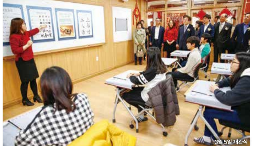
3월 5일 개관식