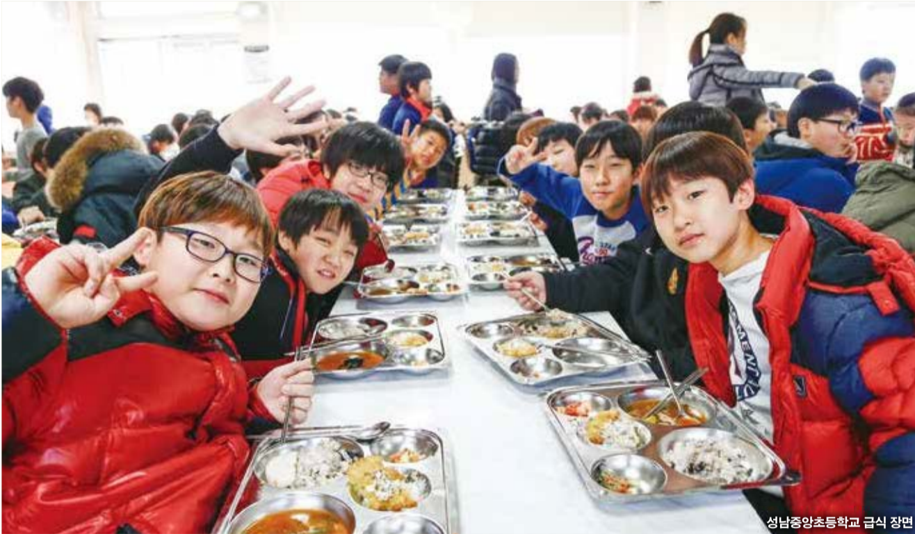
성남중앙초등학교 급식 장면