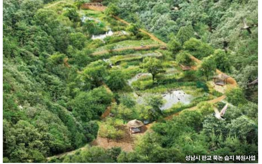
성남시 판교 목논 습지 복원사업

판교공원 내 9,800㎡ 규모 계단형 목논 습지는 과거 농경지로 활용되다가 판교신도시 개발로 도시화되면서 습지 내로 토사