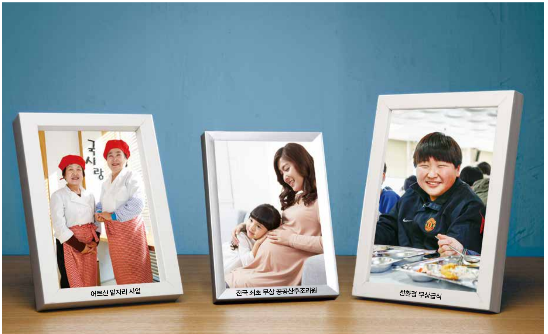
어르신 일자리 사업

아이폰 '앱스토어', 안드로이드폰 구글 'Play 스토어'에서 '비전성남' 앱을 무료로 다운받으시면 됩니다.