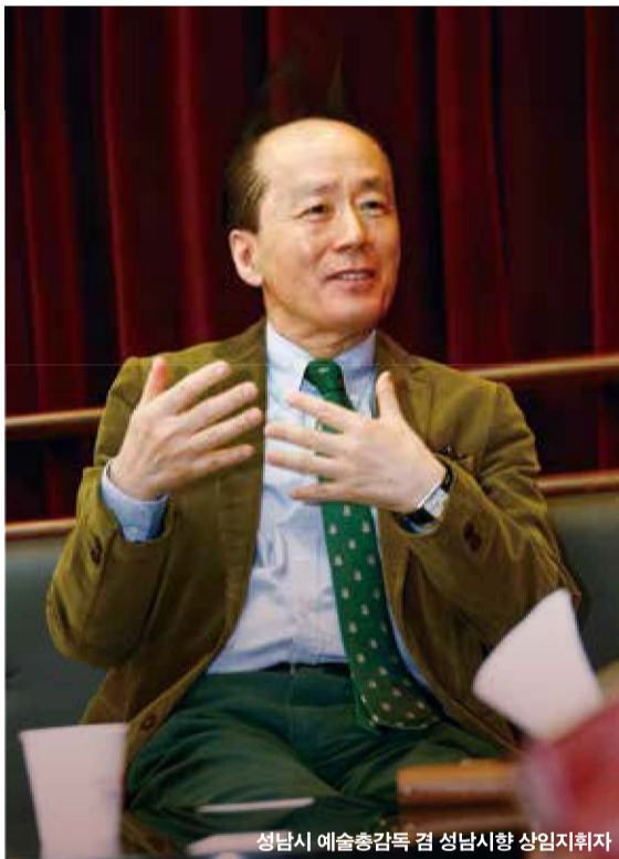
성남시 예술총감독 겸 성남시향 상임지휘자

“연말쯤 시민들에게 시향과 함께 노래할 수 있는 기회를 선물하고 싶어요”