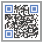
시민순찰대 영상 스마트폰으로 확인하세요

‘어디선가 누군가에 무슨 일이 생기면 틀림없이 나타난다’는 ‘흥반장’이란 영화 속 이야기가 성남 도시 속 커다란 스크린에 펼쳐졌다.