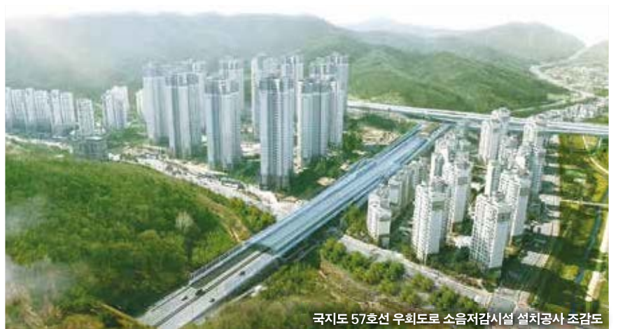
국지도 57호선 우회도로 소음저감시설 설치공사 조감도

설치한다. 시공은 성남시가 조달청에 의뢰해 선정된 (주)오렌지엔씨가 맡는다. 건설사업관리(책임감리)는 (주)대한콘설턴트와 (주)용마엔지니어링이 맡는다. 성남시는 이곳 도로를 이용하는 시민 불편이 없도록 10개월 공사 기간에 작업 대차(낙하물 방지시설)도 설치한다. 안전요원도 배치해 운중로