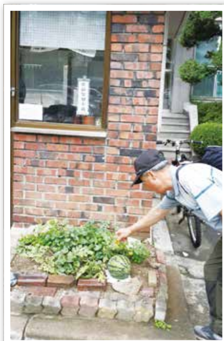
잘 익은 수박 하나