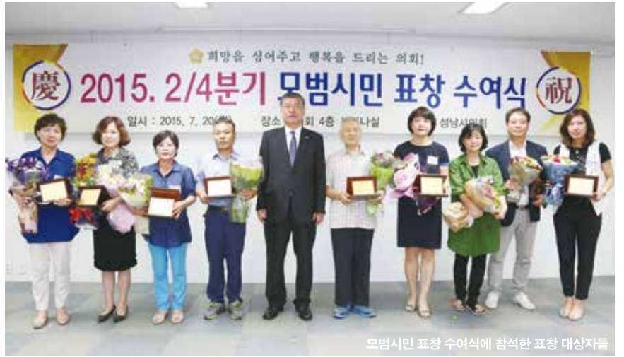
모범시민 표창 수여식에 참석한 표창 대상자들

상조례」에 따라 ‘의정 및 지방자치와 지역발전’에 기여한 시민들은 분기별 포상 관할 구청장의 추천과 의회 공적심사위원회 심사를 거쳐 표창 대상자로 선정된다. 그동안 「시의회 포상규정」에 근거해 조직 및 단체에 속한 시민만이 표창을 수여받을 수 있었다. 그러나 올해 조례 제정으로 그 폭이 넓어진 것이다.