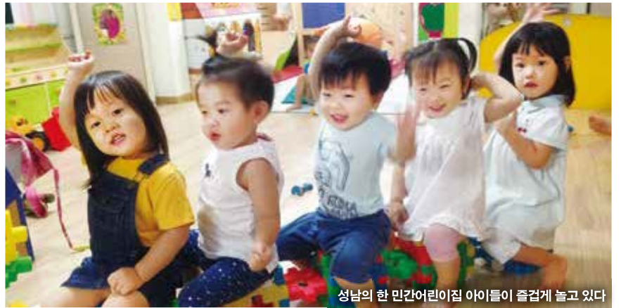
성남의 한 민간어린이집 아이들이 즐겁게 놀고 있다

차액 보육료는 정부가 국공립어린이집 보육료 월 22만 원을 모든 어린이집 이용 가정에 일괄 적용해 지원하기 때문에 발생한다.