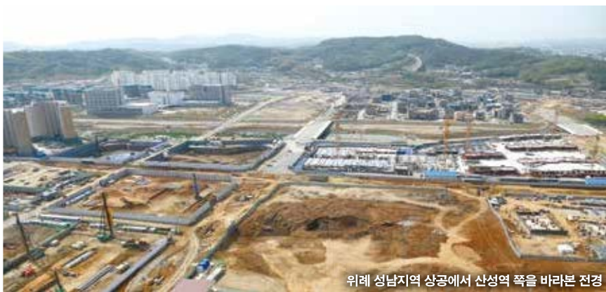
위례 성남지역 상공에서 산성역 쪽을 바라본 전경

올해 11~12월 입주 시작되는 위례신도시 성남구역 3개 블록에 내년 3월 이전에 9곳의 신규 인가 어린이집이 생길 전망이다.