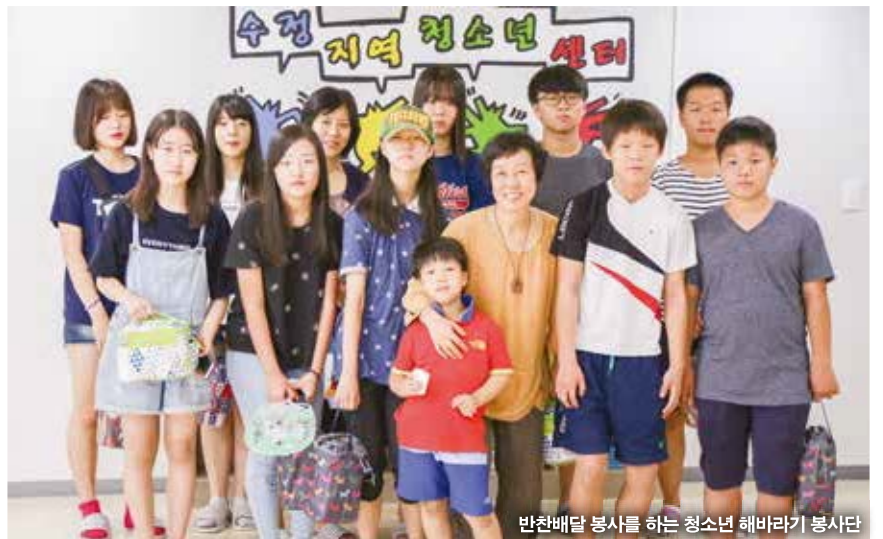
반찬배달 봉사를 하는 청소년 해바라기 봉사단