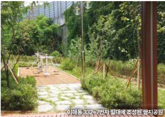
이매동 332-7번지 일대에 조성된 쌈지공원

성남시 분당구 이매동 332-7번지 일대 1천㎡ 규모 자투리땅에 쌈지공원이 조성돼 8월 5일 지역 주민에게 개방됐다.