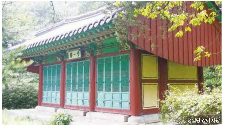
정일당 강씨 사당

또한 효성이 지극하던 정일당은 아버지가 돌아가셨을 때 아버지의 3년 상을 정성껏 치르며 <예기>에서 배운 효를 몸소 실천하기도 했다. 파평 윤씨로 몰락한 양반이었던 윤광연과 혼례를 올린 정일당은 바느질로 생계를 이으면서도 생계 때문에 공부를 중단하고 경상도와 강원도로 다니며 장사를 해야 했던 남편을 격려