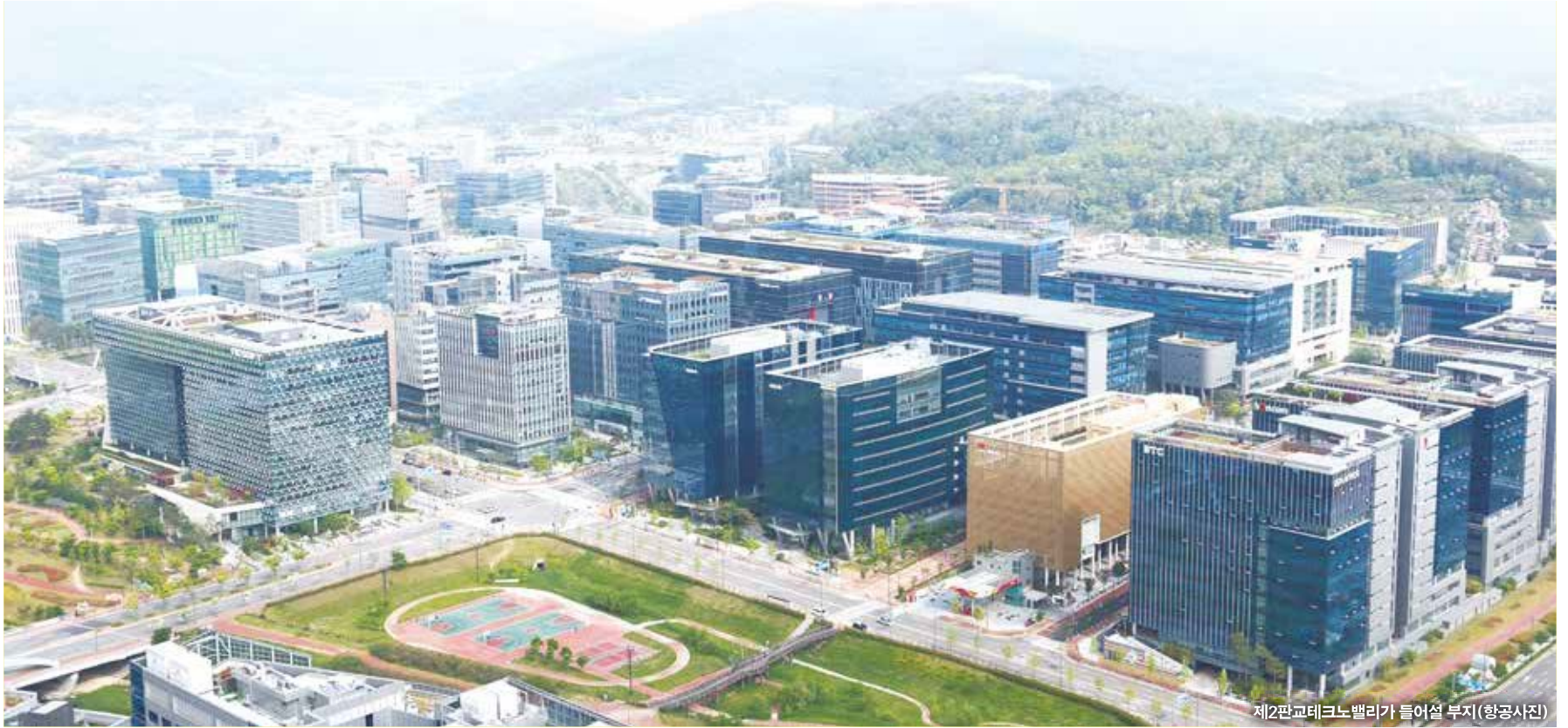
제2판교테크노밸리가 들어설 부지(항공사진)