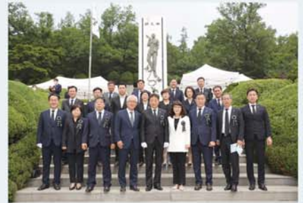
성남시의회는 제65회 현충일을 맞아 수정구 태평동 현충탑에서 애국선열과 호국영령의 넋을 기렸다.(6월 6일)