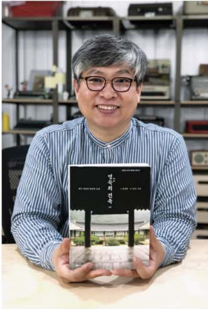
『명묵(明默)의 건축』 김개천 지음 컬처그라퍼 펴냄