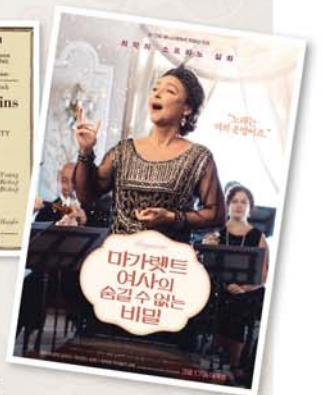
플로렌스의 말을 생각

하며 망설이지 마시길. "누군가는 내가 노래를 못한다고 말할지도 모른다. 하지만 누구도 내가 노래를 안 했다고 말할 수는 없을 것이다."