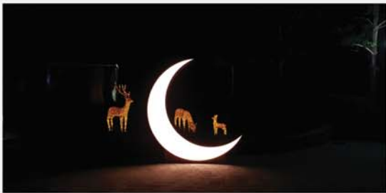
밤에 분당 중앙공원을 산책할 때면 꽃사슴과 달이 아늑하고 몽롱하다. 마치 동화 속 세상에 온 듯하다.