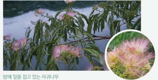
밤에 잎을 접고 있는 자귀나무

여름에 꽃이 피고 밤이면 양쪽으로 마주난 잎을 맛대고 잠을 자는 나무가 있다. 미모사과에 속하는 자귀나무다. 미모사는 특건드리면 잎이 움츠러든다. 이는 작은 잎의 자루 아래쪽에 있는 세포에 물이 많이 저장돼 꽃꽂함을 유지하다가 자극을 받으면 수분이 빠져나가 팽압이 감소하면서 잎이 닫히는 현상이다.