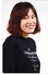
김미옥 수정구 치매안심센터

수정구보건소 치매안심센터가 2018년 7월 문을 연 지 2주년을 맞았습니다. 기존 치매조기검진과 등록관리 중심에서 예방, 상담, 인지훈련, 돌봄지원 등으로 확대 운영 중이고, 치매 환자들을 위한 통합관리서비스에 주력합니다. 건강도시로의 인프라 구축을 위해 양지동의 뒷말과 아랫말에 치매안심마을을 조성해 치매친화적 환경조성에도 기여하고 있습니다. 올해는 한국로봇산업진흥원이 주관하는 공모사업에 선정됐습니다. AI 기반 치매예방 로봇 9대(보건소 3, 노인종합복지관 6)를 활용해 서비스 접점을 확대하고 4차 산업혁명 시대에 선제적으로 서비스를 확대해 나갈 계획입니다. 언제나 노인건강돌봄에 최선을 다하겠습니다.