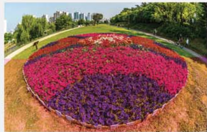
아파트 바로 옆 녹색지대는 야탑2동 주민들이 만든 ‘우리 동네 초록길’ 인절미길이다. 산책하고 자전거 타는 시민들의 모습이 즐거워 보인다.