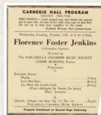
플로렌스 포스터 젠킨스 카네기홀 프로그램