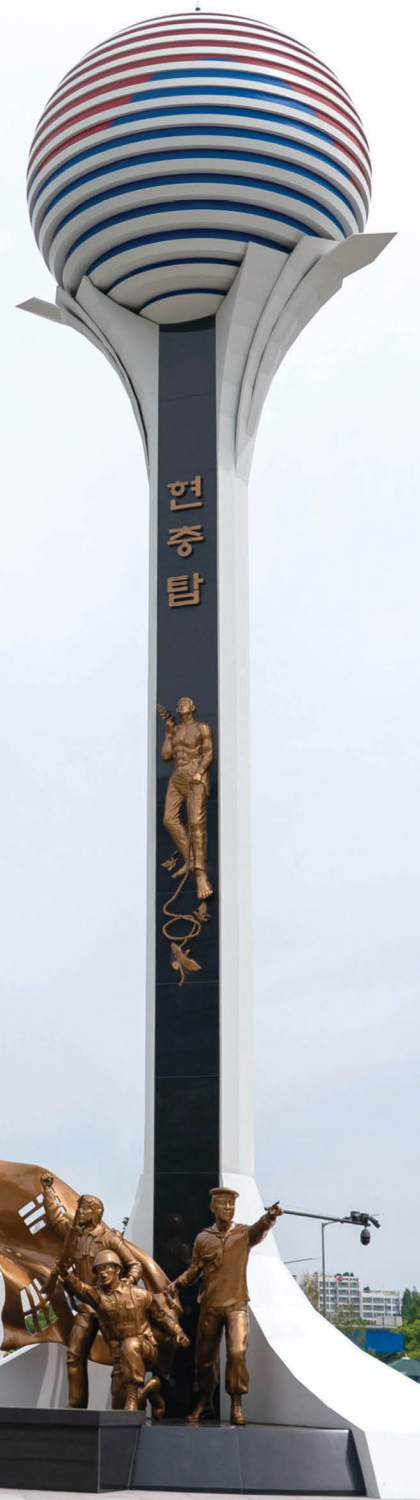
지난해 성남시청 공원으로 이전한 현충탑