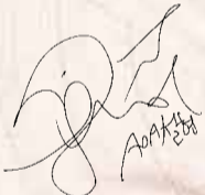
아름다운 선거 홍보대사 설 현