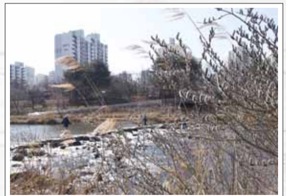
봄 봄 봄 이정순 | 분당구 금곡동

성남시의 랜드마크가 될 만한, 시청 앞 육교가 개통됐다. '도시 이미지의 미래 희망'을 상징한다는 육교의 디자인은 많은 시민과 성남의 앞날을 축복해 줄 것이다. 특히, 밤의 시청육교 모습은 정말 환상적이다.