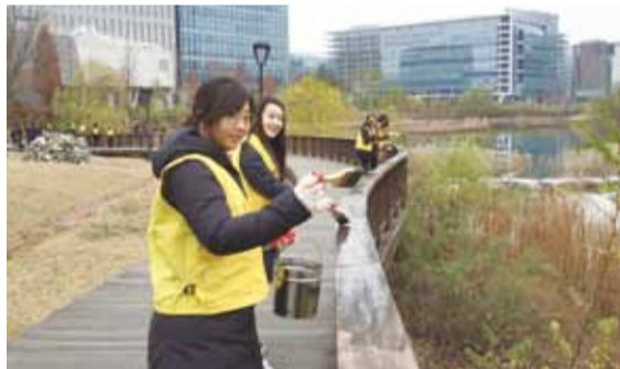
▲2015년 11월 에이텍 직원들의 1사 1공원 사업 참여 활동, 화랑공원 데크 도색 작업

필요한 경우 봉사활동시간 인정 등 인센티브를 준다. 현재 성남시 1사 1공원 사업에 참여하고 있는 기업이나 단체는 모두 13곳(710명)이다.