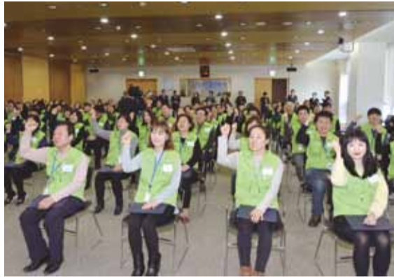
▲3월 3일 성남시 체납실태조사반 출범식

시는 지난해 5월 첫 성남시 체납실태조사반을 꾸려 200만 원 미만 지방세 체납자 10만6,535명의 체납