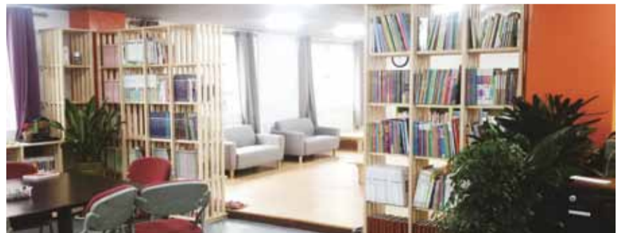
▲시민 사랑방으로 리모델링한 중원기업 직원휴게공간

1996년 성남시청 기능직 공무원과 미화원들이 설립, 41명 근로자 전원이 공동지분으로 참여한 시민주주기업이다. 그 후 2012년 수집·운반업체로는