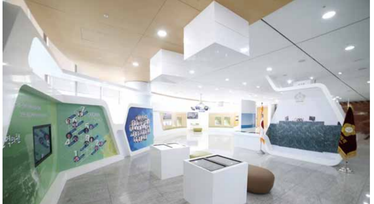
▲홍보관 내부 모습

성남시의회 박권중 의장은 이날 개관식에서 “시민의 대의기관으로서 풀뿌리 민주주의의 근간이라 할 수 있는 지방의회는 그 위상과 역할을 더욱 발전시켜 나갈 책무가 있으며, 신뢰 받는 의회상을 구현하기 위해서는 의정에 대한 시민들의 관심과 참여가 무엇보다 필요하다고 생각한다. 오늘 개관하는 홍보관이 우리 성남시 의정의 역사를 체계적으로 기록하고 전시해 시민들에게 알릴 수 있는 좋은 발판이 되기를 희망한다. 또 의원들의 적극적인 활동 모습을 생생하게 전달함으로써 시민과 의회가 한층 더 가까워질 수 있는 가교 역할을 하게 되리라 기대한다”고 밝혔다.