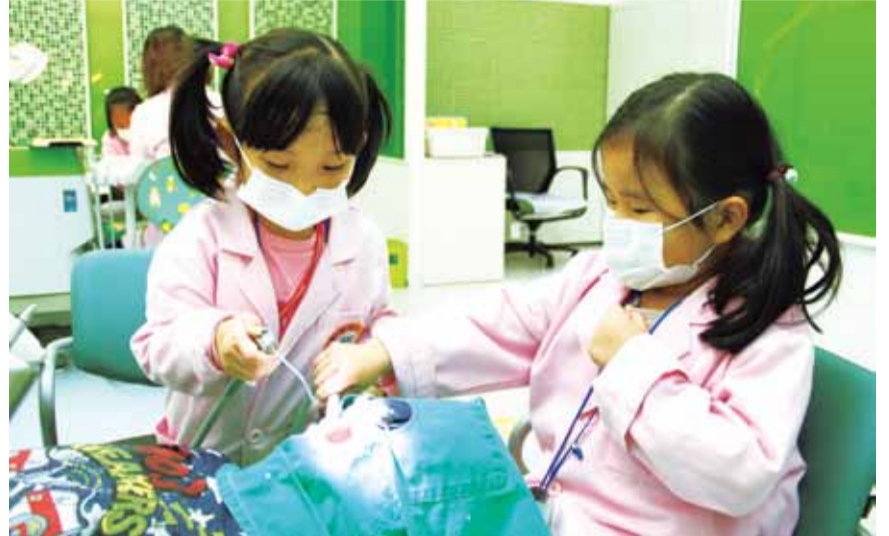
▲한국잡월드 어린이 체험관

시는 치과주치의 의료지원에 관한 대상자 선정, 진료범위, 지원액의 기준, 의료비 지급 방법 등을 심의할 치의학·의료 관련 교수 및 전문가 등 10명 안팎으로 구성된 지역협의체도 운영