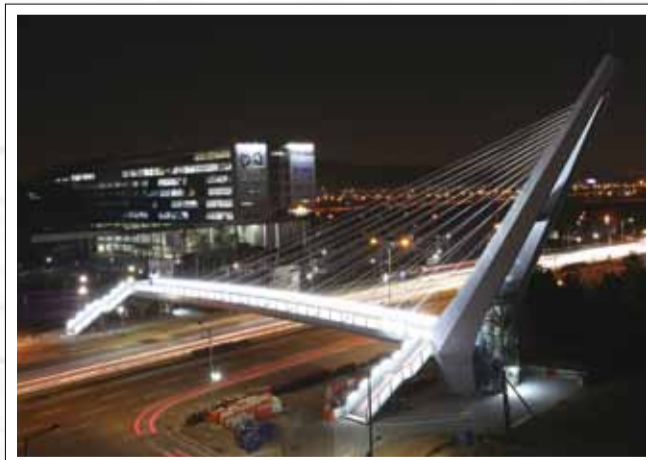
시청육교 개통하다 김옥령 | 중원구 여수동

보내실 곳 : <비전성남> 편집실 031-729-2076~8 이메일 : sn997@korea.kr