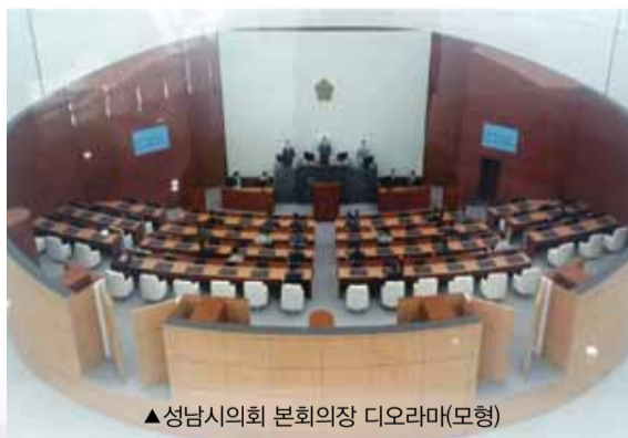
▲성남시의회 본회의장 디오라마(모형)