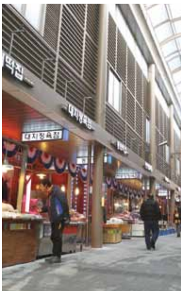
▲수정구 태평동에 위치한 현대시장