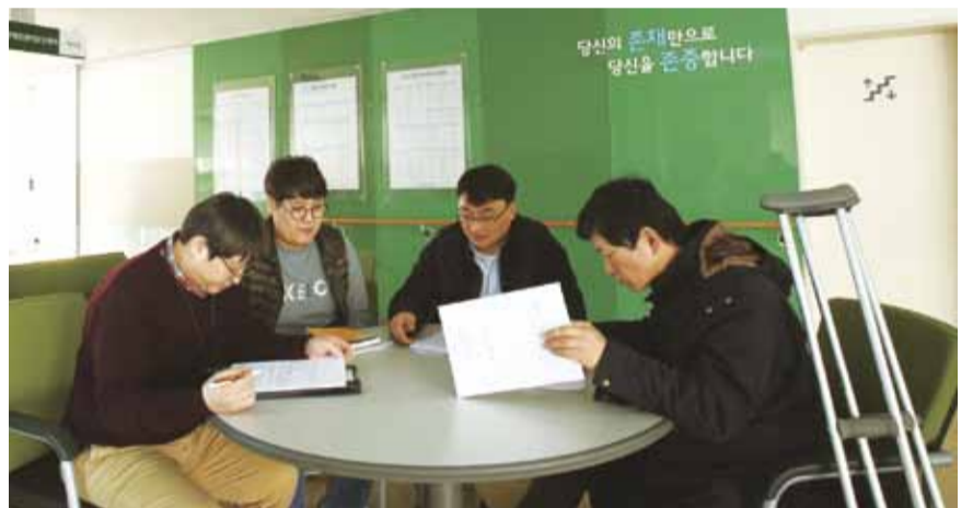
▲전국 최초 민·관 합동으로 2012년 개관한 성남시 장애인권리증진센터

동받고 더불어 변화하고 성장한다”는 장애인권리증진센터다. 센터의 지속적인 노력과 시민들의 올바른 인식향상으로 장애인의 사회참여가 늘어나고 존엄성의 가치가 높아