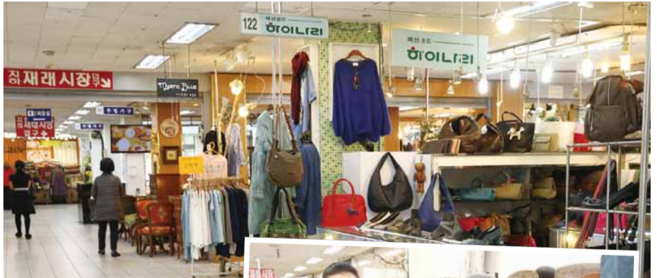
▲분당구 수내동에 위치한 돌고래 시장

그동안 본시가지를 관통하는 수정로와 산성대로 일대의 전통시장과 골목상점가 활성화 사업에 주력하면서