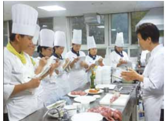
▲성보경영고 외식조리경영과 학생들 실습